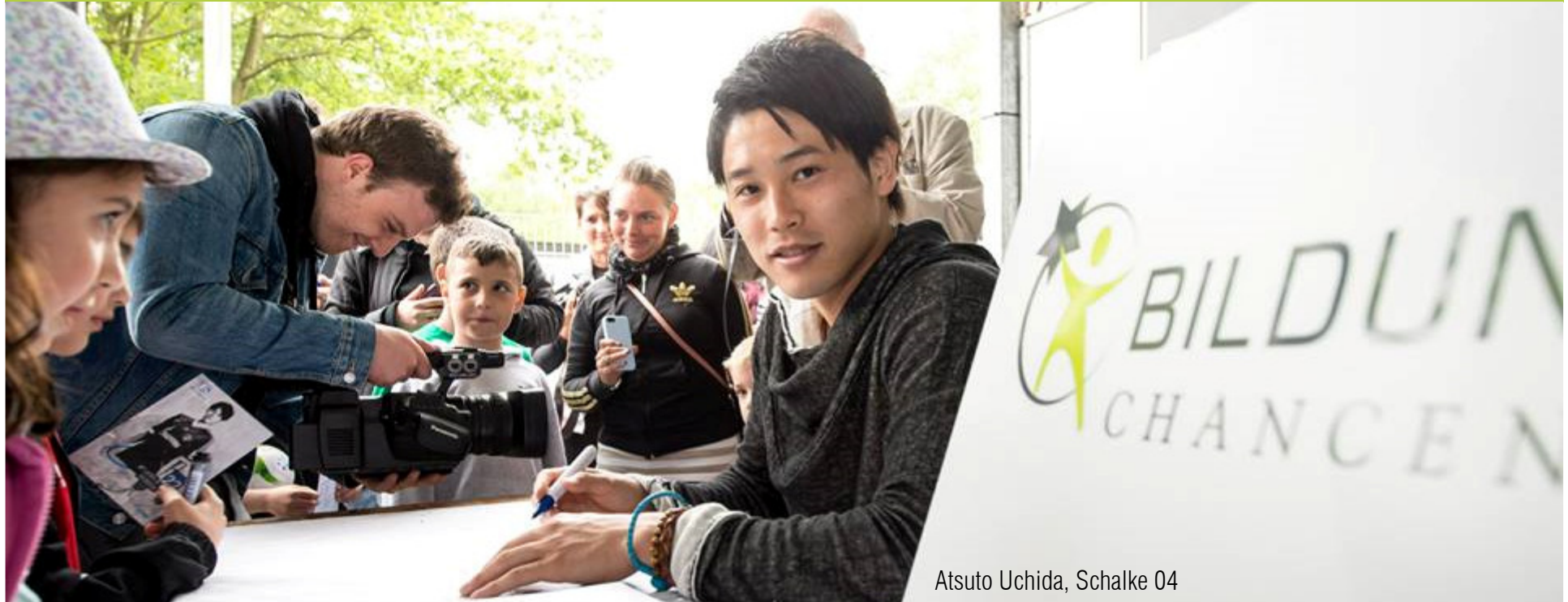
Atsuto Uchida, Schalke 04

„ES GIBT NUR EINS, WAS AUF DAUER TEURER IST ALS BILDUNG, KEINE BILDUNG.“ John F. Kennedy